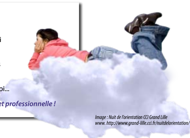
Image : Nuit de l'orientation CCI Grand Lille www.http://www.grand-lille.cci.fr/nuitdelorientation/

Le tout dans une ambiance détendue et professionnelle !